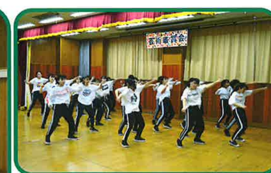
東葉高校ダンスドリル部の息の合ったダンス 若さと躍動感にあふれていました。