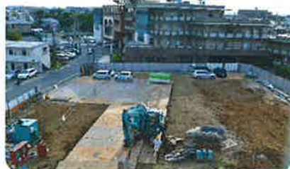
写真上: 2019年5月 建設準備工事着工時 写真右上: 2019年10月 写真右: 2019年12月末 とともに当院屋上より撮影

患者様、当院に来院される方、近隣在住の皆様には、引き続きご迷惑をおかけいたしますが、ご了承賜りますよう、お願い申し上げます。